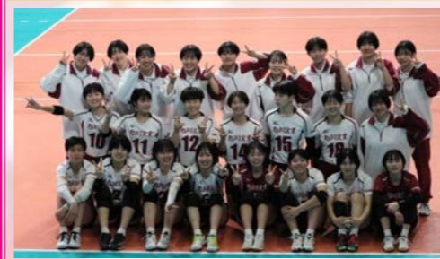
女子バレーボール部 第76回 全日本バレーボール高等学校選手権大会 第3位

旭川実業高校では三年間を通して人としてもプレーヤーとしても成長出来ました。これからのたくさんの壁が目の前に立ちはだかると思いますが、三年間学んだこと、経験したことを活かして何事にも全力で打ち込んでいきます。ありがとうございました。