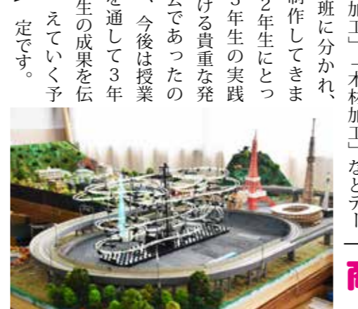
写真：ジオラマ班の制作物

毎年1月末に行われている課題研究発表会ですが、今年はコロナウイルスの影響で中止となりました。3年生はこの発表会に向けて1年間「電子工作」や「プログラミング」、「機械加工」、「木材加工」などテーマごとの班に分かれ、研究・制作してきました。2年生にとっては3年生の実践が聞ける貴重な発表会であったので、今後は授業を通して3年生の成果を伝えていく予定です。