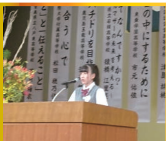
「総文祭での経験はとても貴重なものだったと感じています。今後は進路に向けて、全国レベルのある生活の心がけたいです。」