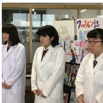
白衣を羽織る普1Sの生徒

7月29日～8月1日までの4日間、小学生向けの夏休み図書館講座が実施されました。29・30日は「読書感想文の書きかた講座」、31日は「塩と水でアイスづくり講座」、8月1日は「宝石せっけんづくり講座」が開かれ、36名の児童が参加してくれました。